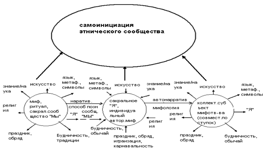
Рис. 1. Мифотворчество и наррадигма как способ методологизации

Суть этой модели – миф и нарратив как исконные и непреходящие составляющие человеческой психики, душевности и духовности (Татенко, 2006) Эвристическая ценность предлагаемой модели – в возможности с их помощью методологизировать многомерный объект исторической психологии в предметной области человеческого «Я».