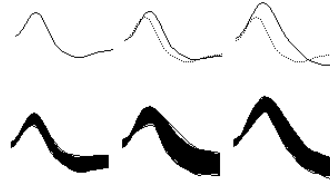
Рис. 1. Спайки-образцы (верхний ряд, сплошные линии) и группы (нижний ряд; спайки наложены друг на друга) после сортировки спайков нейрона 1602

Показатель повреждения вычисляли для каждого полного цикла пищедобывательного поведения, т. е. для набора из пяти актов от вынимания головы из кормушки и поворота к педали или кольцу до опускания головы в кормушку для получения пищи. Каждый спайк нейрона принадлежал к группе сходных по форме и амплитуде спайков, сформированной в результате их сортировки на основе выбранного спайка-образца (рисунок 1). Для каждого цикла поведения вычисляли среднюю частоту спайков, принадлежащих только одной из таких групп. Эти отдельные частоты отражают вклад спайков данной группы в частоту спайков в данном цикле (последняя является суммой отдельных частот). Например, средняя частота спайков нейрона 1941 незначительно меняется от цикла к циклу, однако вклад спайков, принадлежащих разным группам, сильно меняется (рисунок 2). Затем каждую отдельную частоту выражали в единицах частоты всех спайков в данном цикле (т. е. получали долю спайков каждой группы в частоте в данном цикле вместо абсолютной частоты).