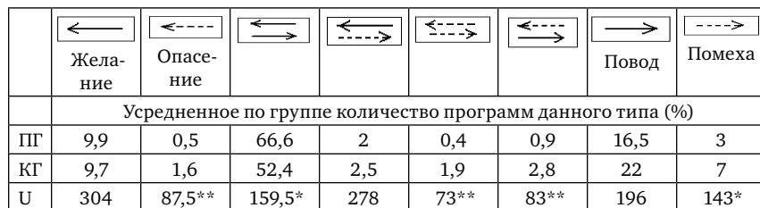
Таблица 1 Жизненные программы обследуемых женщин

Примечание: * – уровень статистической значимости при p < 0,05 . ** – уровень статистической значимости при p < 0,01 . U – критерий Манна-Уитни – статистический критерий, используемый для выявления значимости различий в уровне исследуемого признака. ПГ – группа женщин-предпринимательниц, КГ – контрольная группа женщин.